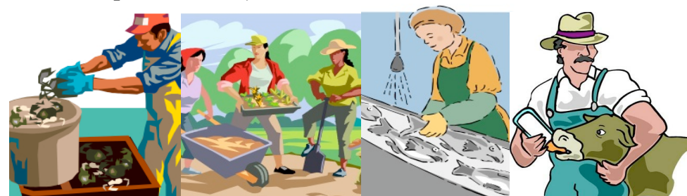
Procesamiento de Pesca

Se ha mudado usted a esta área durante los últimos 3 años para trabajar en una de estas industrias?